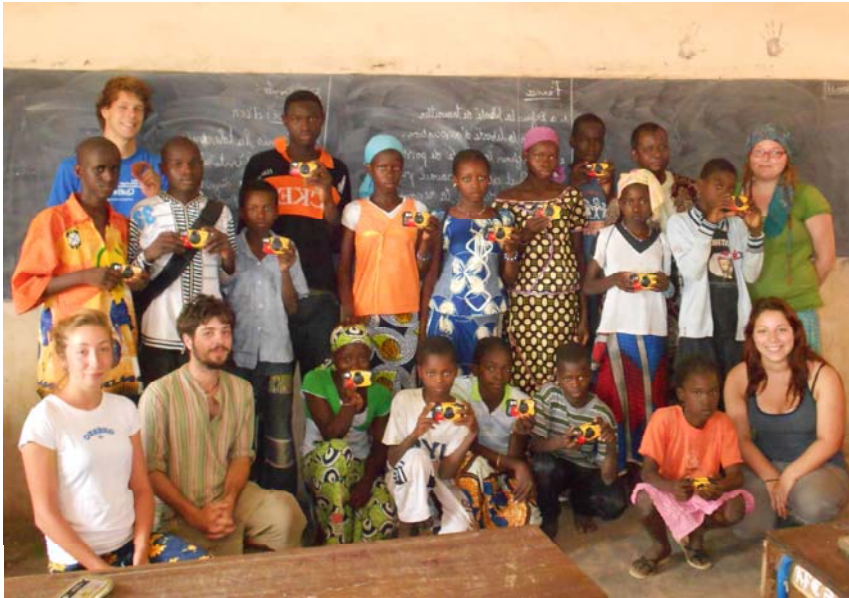
Groupe de stagiaires 2011 au village de Sido