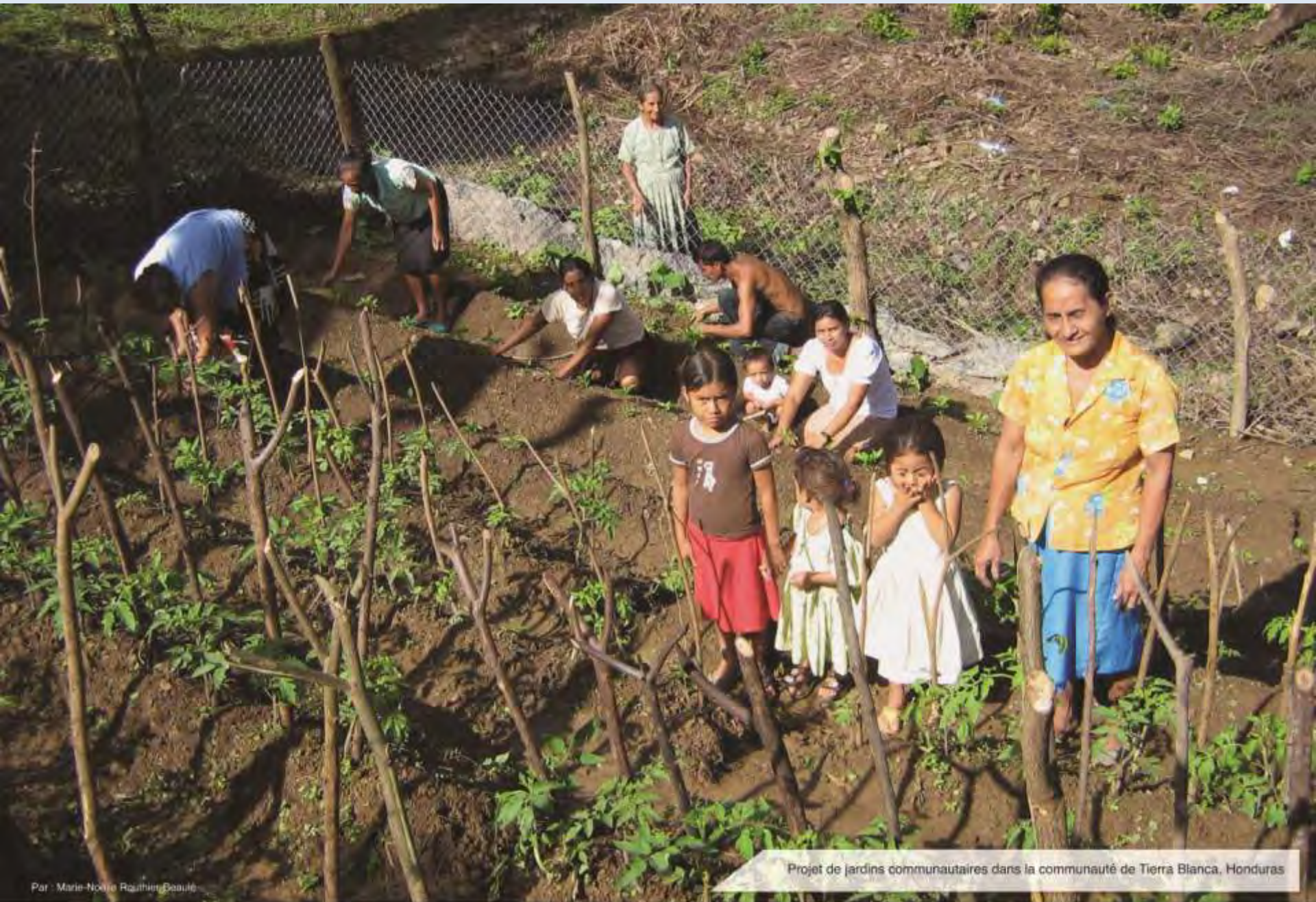
Projet de jardins communautaires dans la communauté de Tierra Blanca, Honduras