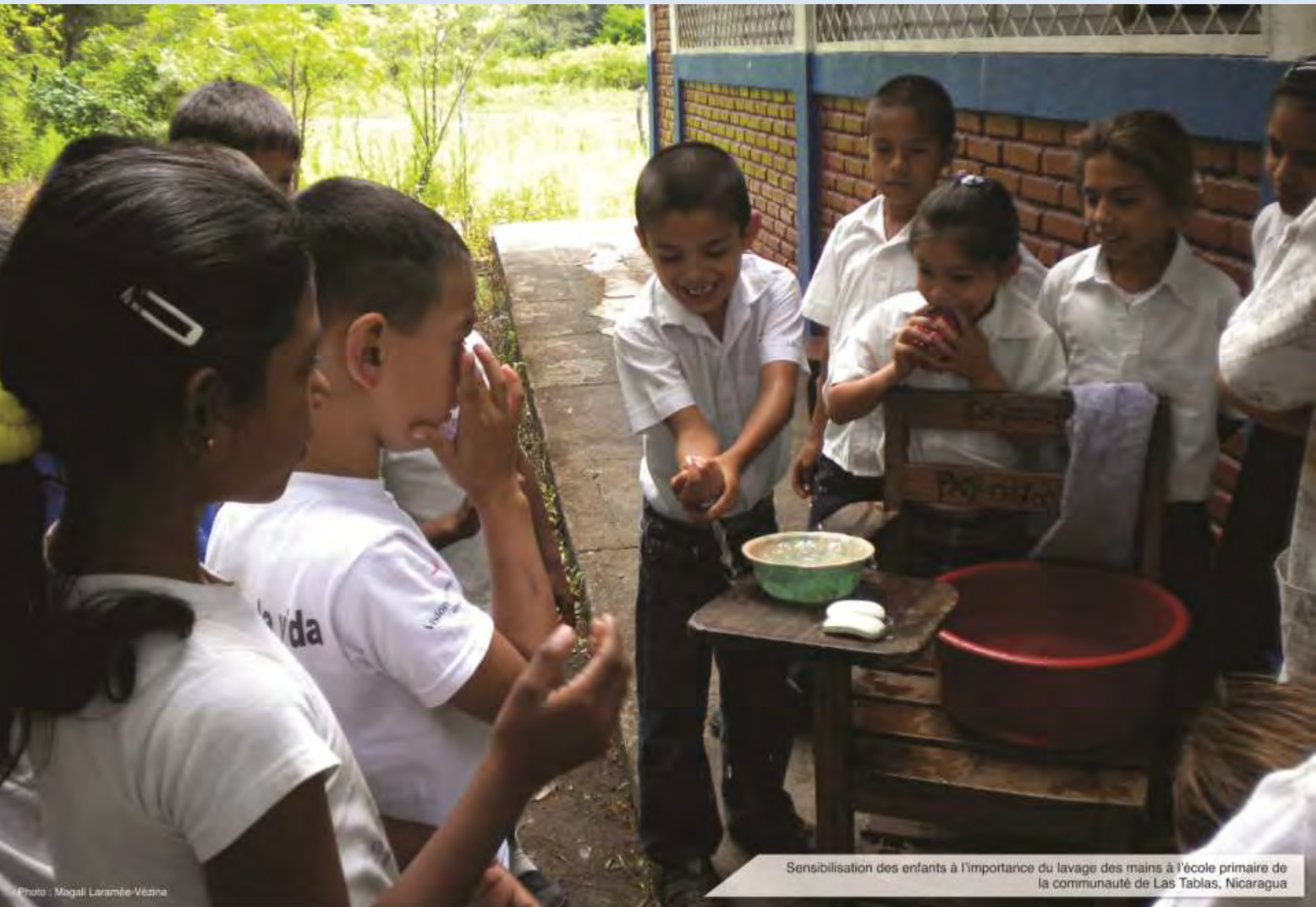
Sensibilisation des enfants à l'importance du lavage des mains à l'école primaire de la communauté de Las Tablas, Nicaragua